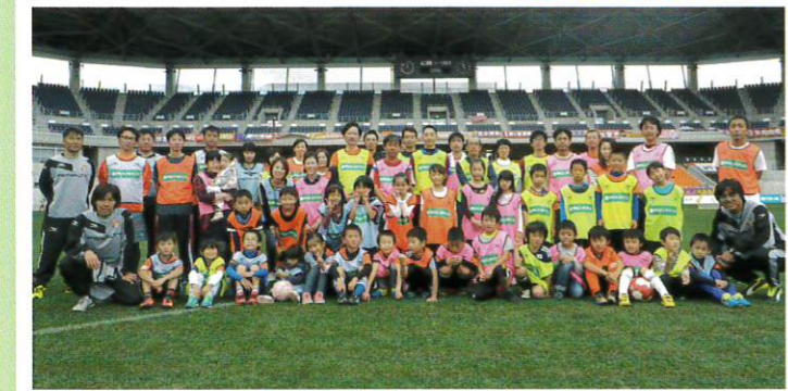
長野パルセイロ・アシレッククラブによる親子のためのサッカー教室

会場/長野スタジアム(ピッチ) 主管/(株)長野パルセイロ・アシレッククラブ 参加対象/小学生とその保護者の方 ※小学生は1~4年生を対象とする。 募集定員/40組(先着順) 実施内容/[受 付] 午前9時30分~午前10時00分 [教 室] 午前10時00分~午前11時30分 その他/運動靴のみ可(スパイクや長靴等は禁止)